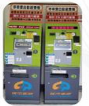
舊型票卡計時計價自動繳費機系統