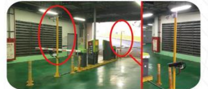
以車牌辨識系統感應，增快進出場速度，並解決票卡易遺失問題。