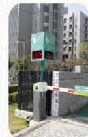
小東路機車入口計數器更新