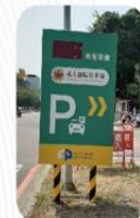
小東路汽車入口引導及計數器更新