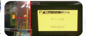
機車區同步更新為車牌辨識進出系統。