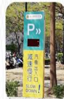
小東路停車場入口計數器及入口告示更新