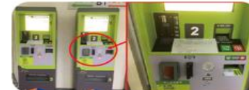
輸入車牌號碼繳費，不需擔心票卡遺失，可找千元鈔及電子支付。