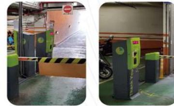
原B1F機車取票進出場設備