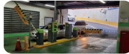
原B1F汽車取票進出場計價設備