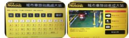
新型觸控介面，圖塊操作方式清楚易懂，輸入車號後有人場影像以利確認。